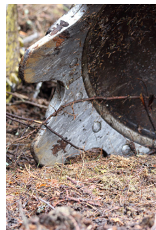
Muokauslautaset vaihdettavilla hampailla.