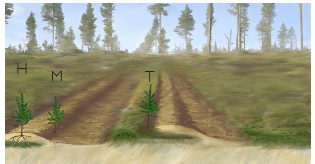
Bracke T28.a muodostaa istutuspaikat kaksinkerroin käännetyistä kunnasta (T), kaksinkerroin käännetyistä kunnasta ja kivennäismaasta (H) tai kivennäismaasta (M).