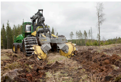
Bracke T28.a kuormatraktoriin asennettuna.